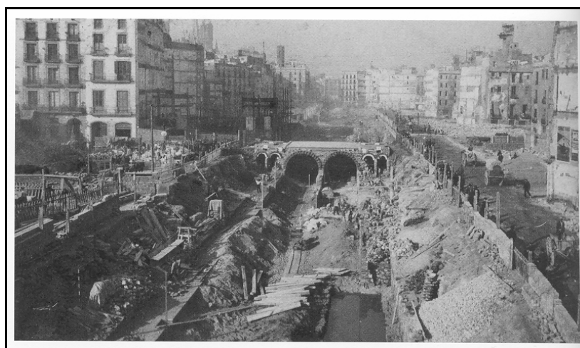
Túnels del futur metro, Via Laietana. (Museu d'Història de la Ciutat)

Però els canvis més importants del barri són a causa de les darreres grans reformes urbanístiques de la ciutat: la creació del carrer Princesa i l'enderroc de la muralla a mitjans del segle XIX, i entre 1908 i 1958 la Reforma, és a dir, la construcció de la Via Laietana. L'obertura física de la Via Laietana va afectar uns tres-cents edificis i unes dues mil famílies.