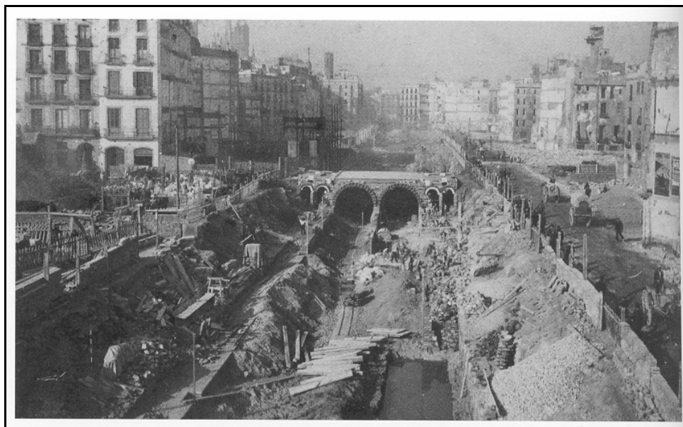
Túnels del futur metro, Via Laietana.

Però els canvis més importants del barri són a causa de les darreres grans reformes urbanístiques de la ciutat: la creació del carrer Princesa i l'enderroc de la muralla a mitjans del segle XIX, i entre 1908 i 1958 la Reforma, és a dir, la construcció de la Via Laietana. L'obertura física de la Via Laietana va afectar uns tres-cents edificis i unes dues mil famílies.