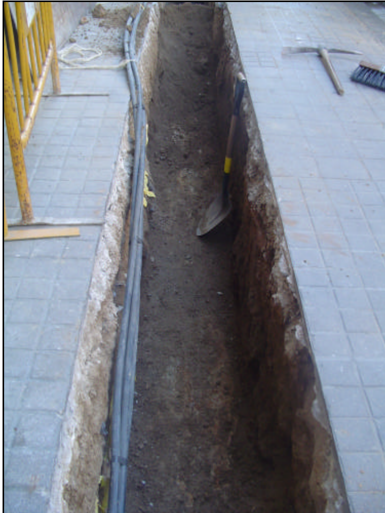
Foto 3: Detall de la rasa durant els treballs constructius al núm. 59-61.